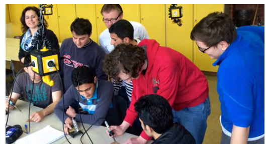
Gelebte Integration: Praktischer Unterricht am BKTm

Die Kreishandwerkerschaft Duisburg hat bereits die ersten Flüchtlinge in einer Umschulungsmaßnahme untergebracht, die sie zum Gesellenbrief für „Anlagenmechaniker für Sanitär-Heizung-Klimatechnik“ führen wird. In Zusammenarbeit mit der Arbeitsagentur für Arbeit, die eine Zusage für Bildungsschecks erteilt hat, sollen zukünftige über 100 junge Flüchtlinge in verschiedenen Berufen ausgebildet werden. Die Maßnahmen beginnen mit 9-monatigen berufsbezogenen Deutschkursen, deren Finanzierung jedoch nicht von staatlicher Seite abgedeckt ist. Unterstützung von dritter Seite ist für dieses Modellprojekt daher unbedingt notwendig.