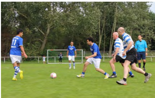
1. MOERSER FLÜCHTLINGSFUSSBALLTURNIER