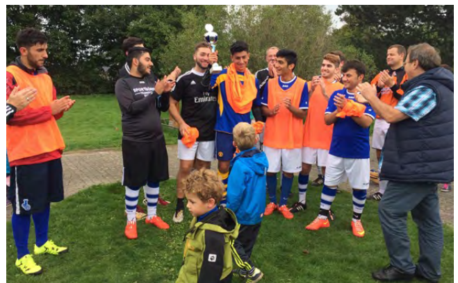
Sieger des Refugee-Cups: Die Mannschaft des Bunten Tisches“