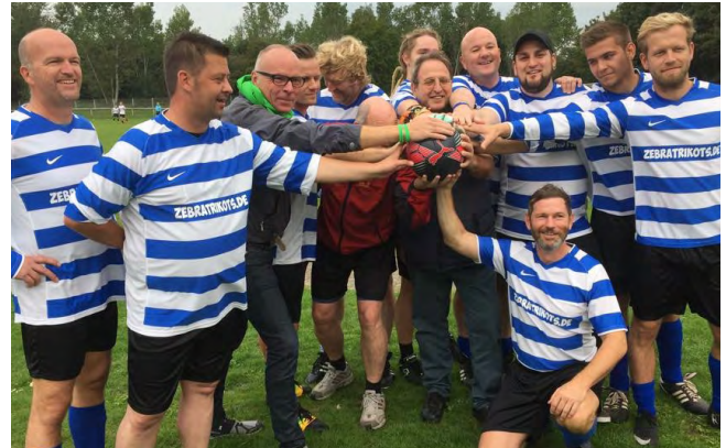
1. MOERSER FLÜCHTLINGSFUSSBALLTURNIER